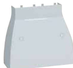
0 201 60