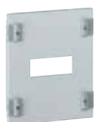
0 203 18