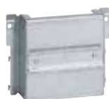
0 202 17