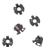
0 200 92