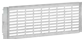
0 202 42